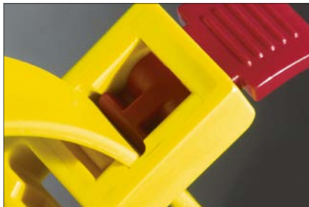
Patentierter „Speedy-Click“ Schnellverschluss zum bequemen Öffnen und Schließen.