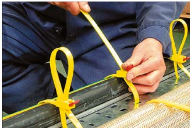
Die Bandenden lassen sich besonders unkompliziert zurückschlaufen.