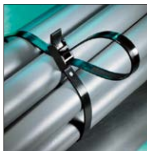
SpeedyTie® – schnell und einfach.